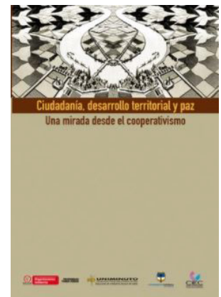
Ciudadanía, desarrollo territorial y paz. Una mirada desde el cooperativismo.