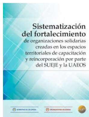
Sistematización del fortalecimiento de organizaciones solidarias creadas en los espacios territoriales de capacitación y reincorporación por parte de SUEJE y la UAEOS