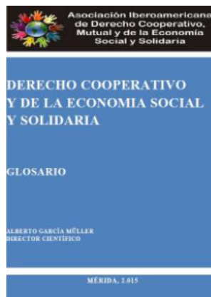
Derecho cooperativo y de la economía social y solidaria.